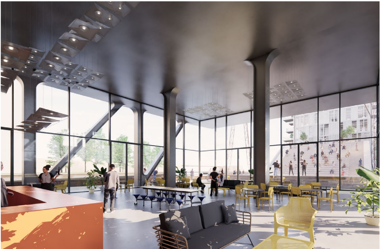
All visualizations and the facilities depicted therein are non-binding and serve illustration purposes only.