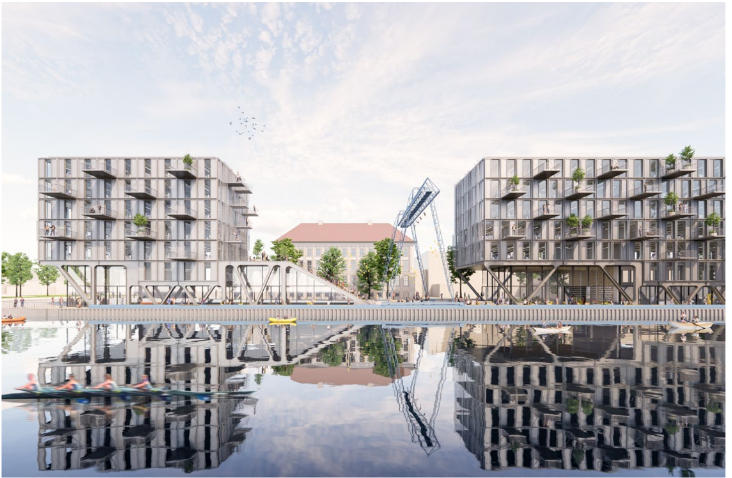
Alle Visualisierungen und die darin dargestellten Einrichtungen sind unverbindlich und dienen Illustrationszwecken.