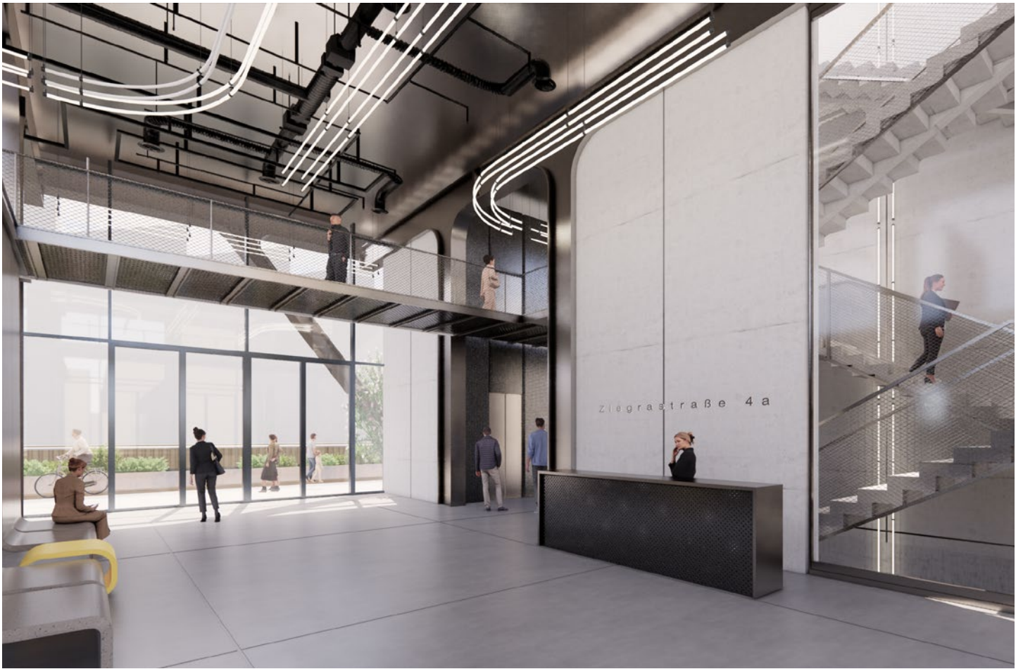
Alle Visualisierungen und die darin dargestellten Einrichtungen sind unverbindlich und dienen Illustrationszwecken.