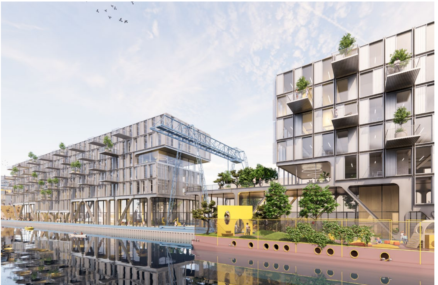
All visualizations and the facilities depicted therein are non-binding and serve illustration purposes only.