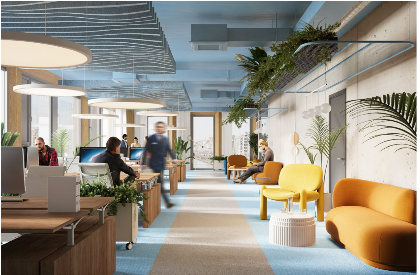
Alle Visualisierungen und die darin dargestellten Einrichtungen sind unverbindlich und dienen Illustrationszwecken.