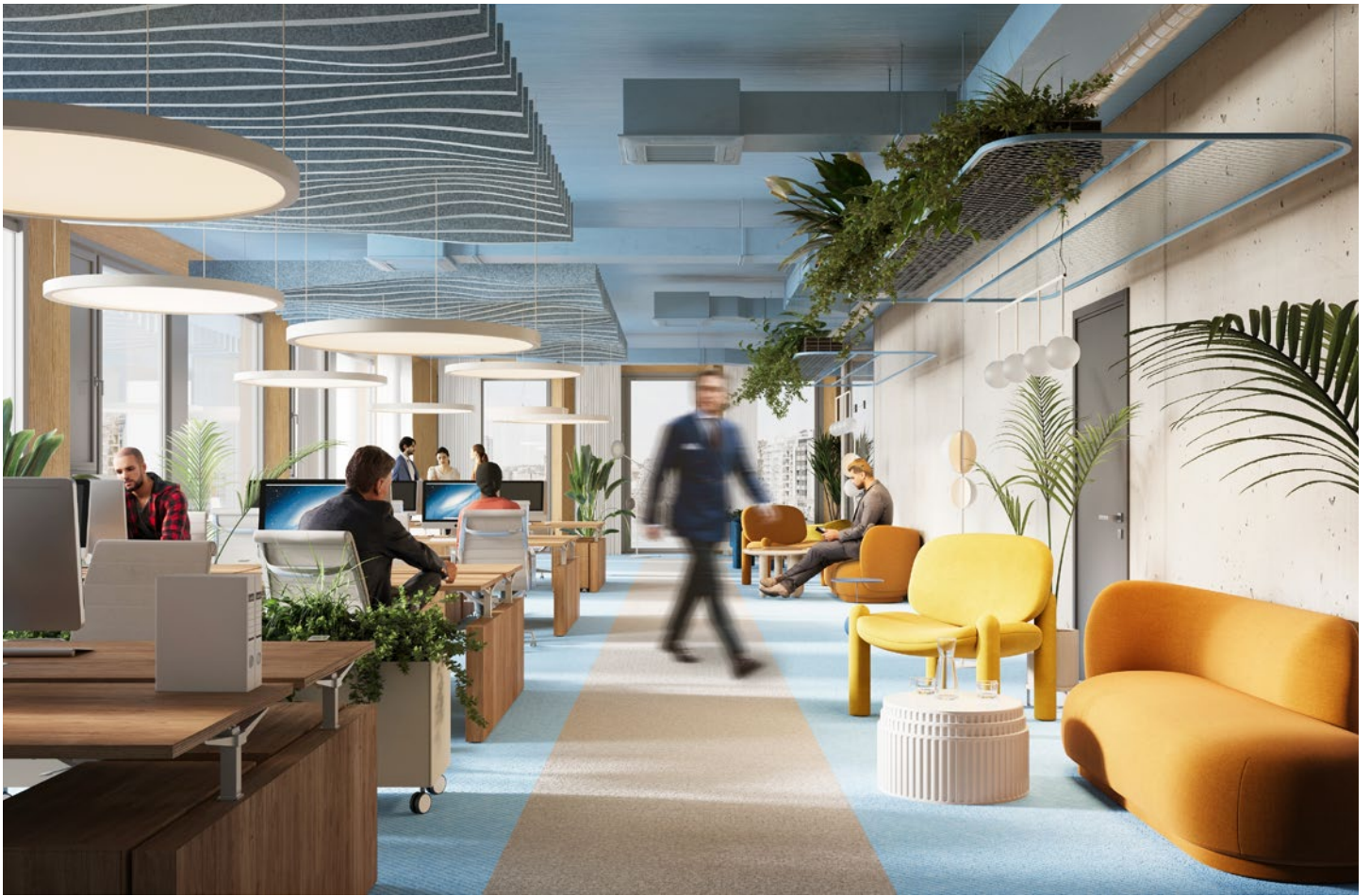
Alle Visualisierungen und die darin dargestellten Einrichtungen sind unverbindlich und dienen Illustrationszwecken.