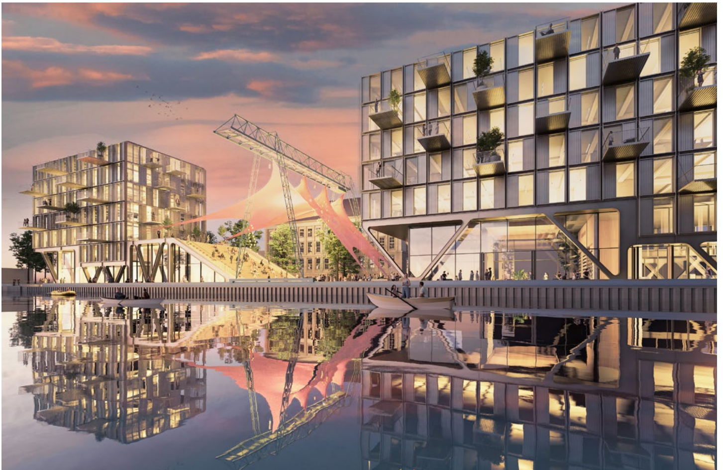
All visualizations and the facilities depicted therein are non-binding and serve illustration purposes only.